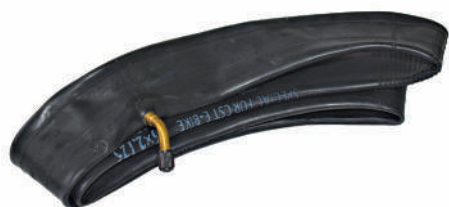
CA-R-100 / CA-R-114

Camera d'aria 24"x1" / 24"x1,75" Inner tube 24"x" / 24"x1,75"