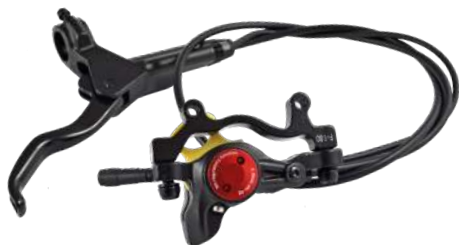
BS-O-274(sx) / BS-O-275 (dx)

Leva freno con blocco per stazionamento. Brake with locking lever.