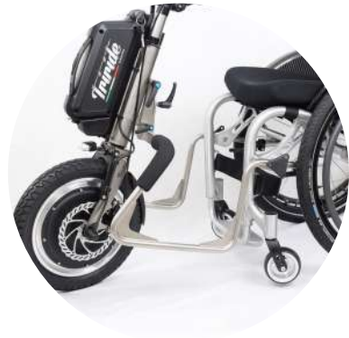
BS-O-421 (dx) / BS-O-422 (sx)

Braccetti saliscendi dx o sx. Up and down brackets (right - left).