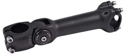
BS-O-185 / BS-O-211

Raccordo manubrio 110/130mm inclinabile. Adjustable handlebar connection 110/130 mm.