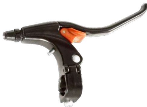
BS-O-203(sx) / BS-O-273 (dx)

Tasto dedicato per freno elettronico Electronical brake button.