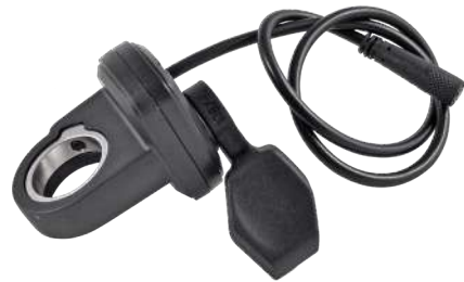
S-R-328 (dx) - S-R-329 (sx)

Acceleratore a pollice (ambidestro). Thumb accelerator (ambidextrous).