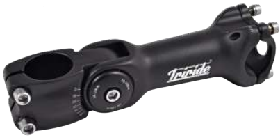
BS-O-222 / BS-O-220

Raccordo manubrio 110/130mm inclinabile. Adjustable handlebar connection 110/130 mm.